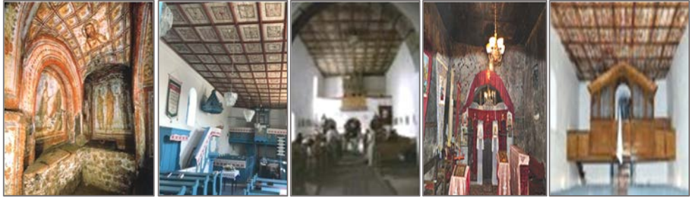
Commodilla-katakomba Szilágyolompért, ref. Csíkdelne r.k. Lupsa, ort. Énlaka-unit.

A festőasztalosok a mennyezeteken kívül a papi széket, a szószéket, a szószék-koronát, az úrasztalát, az éneklőszéket is kifestették a késő reneszánsz, barokkos mintákkal, s így Erdélyben létrehozták az egyházi építészet egyik legmarkánsabb „protestáns” alkotását. 14