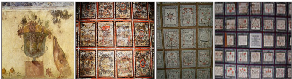
Szt. Sebestyén katakomba

A növényornamentika stilizált növényi elemekből szerkesztett díszítmények, formaelemek gyűjtőneve, mindenike élet- és termékenységjelkép. A katakombákban is találunk virágmotívumokat.