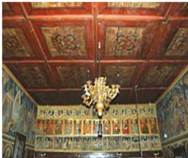
Lupşa, Feber megye