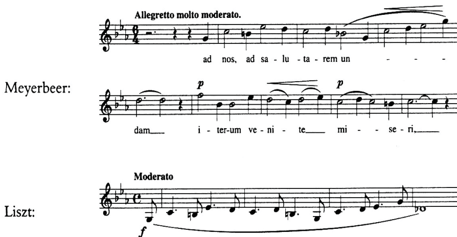
5. kép: Meyerbeer eredeti dallama és Liszt témája 22

A címben szereplő korált (5. kép) – Meyerbeer saját dallamát – az opera első felvonásának 3. jelenetében az anabaptista prédikátorok éneklik. A librettista Eugèn Scribe szövege magyar fordításban így hangzik: Hozzánk, az üdvöt adó vízhez jöjjetek el újra, ti nyomorultak! 23 – azaz latinul: Ad nos, ad salutarem undam, iterum venite misereri.