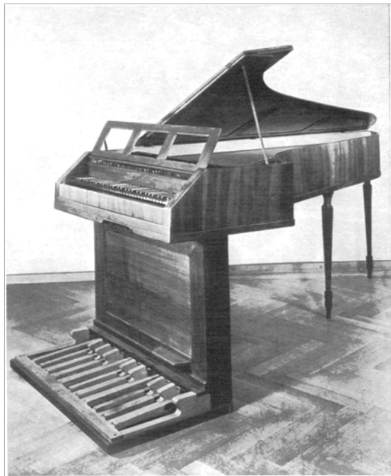
3. kép: Pedálos zongora, 19. század eleje, Nürnberg 13

Liszt billentyűs darabjaiban többször találkozunk a „zongorára vagy harmóniumra”, illetve „orgonára vagy pedálos zongorára” jelöléssel, de nem ritka az „orgonára vagy harmóniumra” megjegyzés sem. Mindezek nemcsak a kor előadói gyakorlatát tükrözték, hanem a művek szélesebb körű terjesztését is segíteni kívánták. 14 Ennél a grandiózus, megközelítőleg harminc perces alkotásnál a hangszerválasztás szempontjából három előadási lehetőséggel számolhatunk: orgonával, pedálos zongorával – és a címlapon olvashatókat túlhaladva – zongorával, de négy kézre. Vajon melyik felelt meg legjobban Liszt elképzelésének?