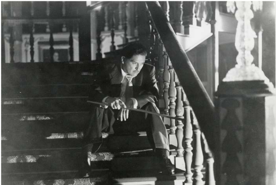
Fig. 4 : https://www.moma.org/calendar/events/3646