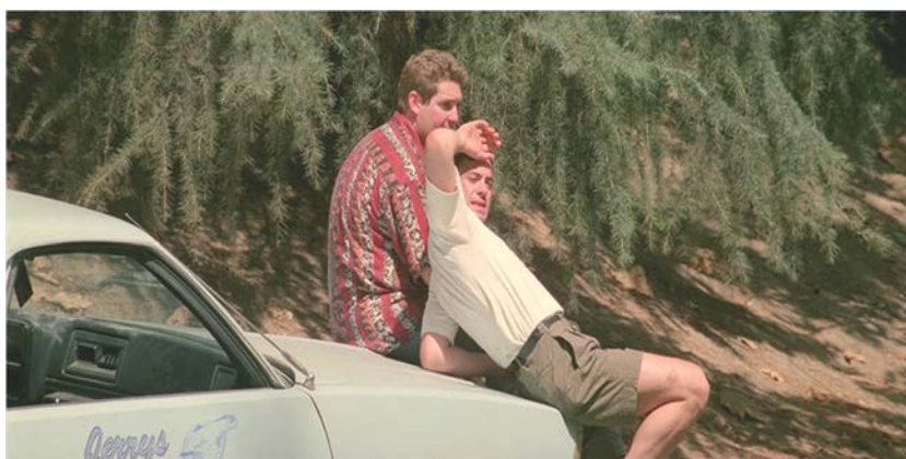
Fig. 5 & 6 : https://www.listal.com/viewimage/8391816 https://www.listal.com/viewimage/15428512

La fin de Short Cuts se situe entre les deux approches de Buñuel, parce que l'acte meurtrier gratuit, doublé d'un tremblement de terre dans la vie de tous les personnages, semble illustrer la paranoïa structurelle qui suppose la forclusion psychique, de même qu'un passage à l'acte qui permet la restructuration symbolique du sujet. De toute manière, la scène du tremblement de terre qui interrompt les soliloques symptomatiques des personnages et qui permet à la fois l'acte meurtrier est symptomatique pour cette paranoïa