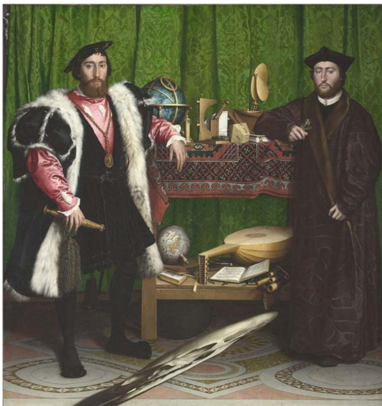
Fig. 1 : http://thedsproject.com/portfolio/deciphering-the-gaze-in-lacans-of-the-gaze-as-objet-petit-a/

Altman lui-même utilise l'image anamorphique jusqu'aux années '80, y renonçant, selon ses propres paroles, seulement lorsqu'il s'est rendu compte que ses films seraient vus aussi sur de petits écrans: « But I liked the anamorphic image because I believe that's the way I believe you see. Now I'm kind of blind on one side but looking at you, I'm really seeing that shape. » 9 Plus encore, avec ses opérateurs, Altman avait l'habitude d'obtenir un effet de brouillard sur la pellicule par une technique de la surexposition, comme par exemple les images embrumées de McCabe et Madame Miller ,