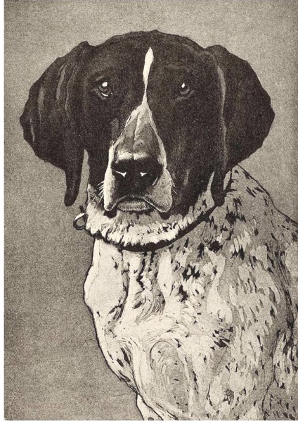
Fig. 3. Otto Fikentscher, Feldmann Jagdhund (Radierung, abgebildet in: Die graphischen Künste , S. 97).