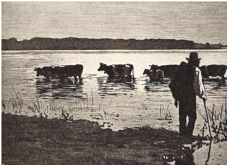
Fig. 2. Otto Fikentscher, Kuhherde (Radierung, abgebildet in: Die graphischen Künste, S. 95).