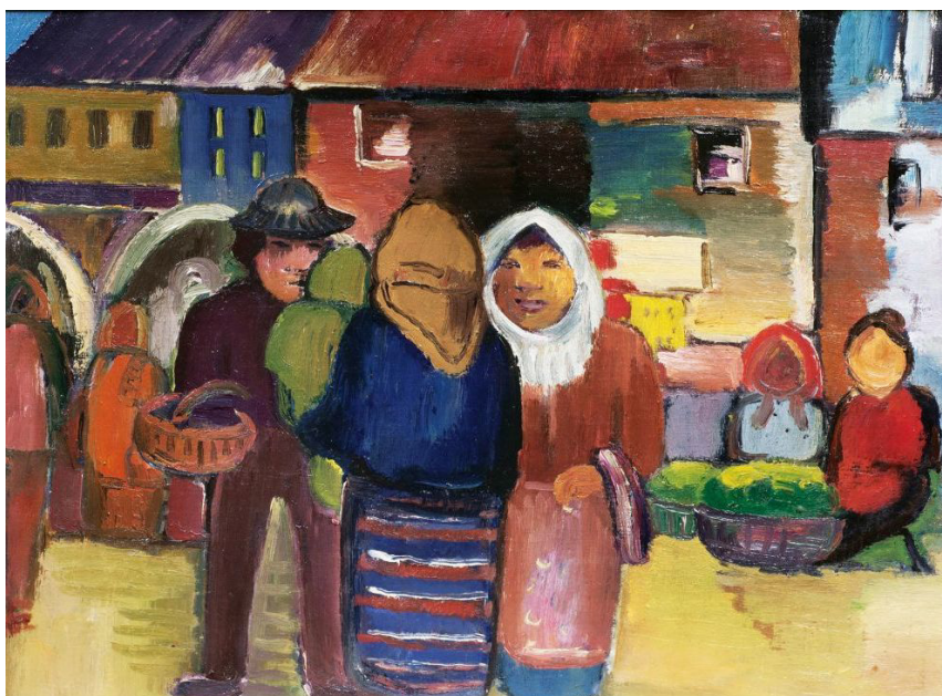
Fig. 6. Franz Domscheit, Auf dem Markt (Öl auf Leinwand, https://www.auktionshaus-stahl.de/de/artikel/101210-franz-domscheit-auf-dem-markt )