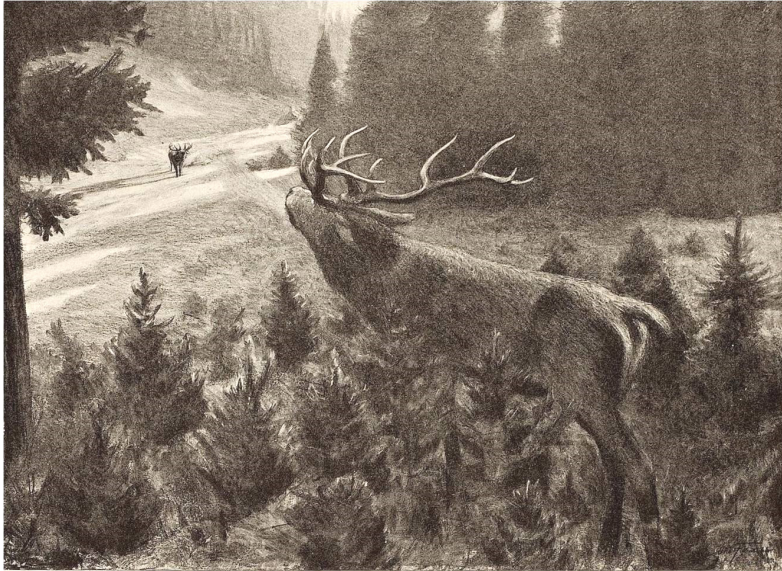
Fig. 1. Otto Fikentscher, Zwei Hirsche (Zeichnung, abgebildet in: Die graphischen Künste, Wien 1905, herausgegeben von der Gesellschaft für vervielfältigende Kunst, S. 98; https://digi.ub.uni-heidelberg.de/diglit/gk1905/0114 )