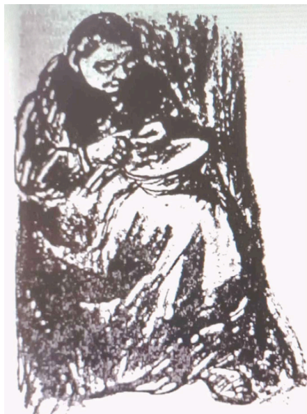
Fig. 5. Franz Domscheit, Mutter bei der Arbeit (Grafik, abgebildet in: Das Ostpreußenblatt, 11. November 1995, S 9.

AUSSTELLUNGEN DER MALER OTTO FIKENTSCHER (1862 ZWICKAU–1945 BADEN BADEN) UND FRANZ DOMSCHEIT/ PRANAS DOMSAITIS (1873 KROPIENS/GAJEWO–1962 KAPSTADT) IN HERMANNSTADT/SIBIU