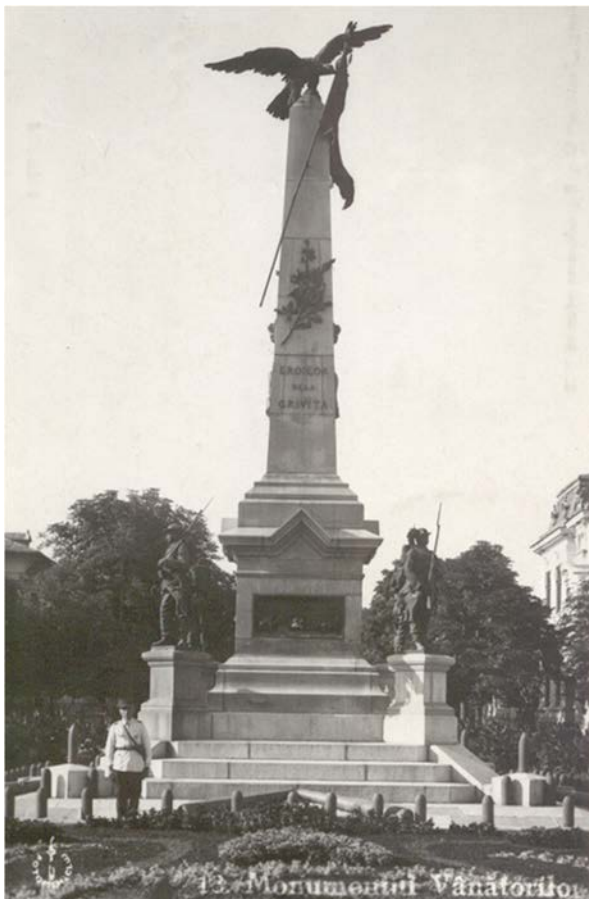
Fig. 2. Domenico Rupolo, Giorgio Vasilescu. Monumento dedicato al II Battaglione cacciatori di montagna ( Monumentul Batalionul II vânători ) sito in Piața 1 Decembrie a Ploiești (1897) in una cartolina del 1935.