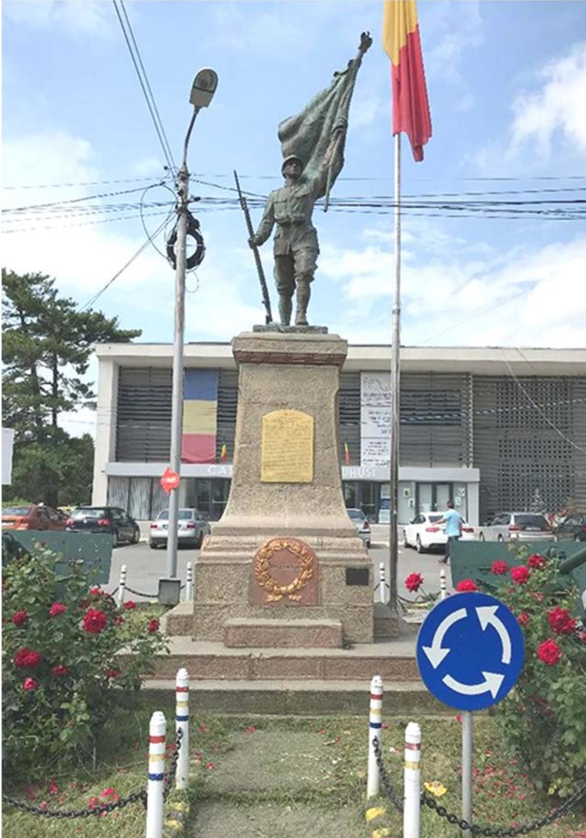
Fig. 12. Ion Schmidt-Faur, Vincenzo Puschiasis. Monumento ai caduti della Prima guerra mondiale a Buhuși, distretto di Bacău (Strada Republicii, 1925).