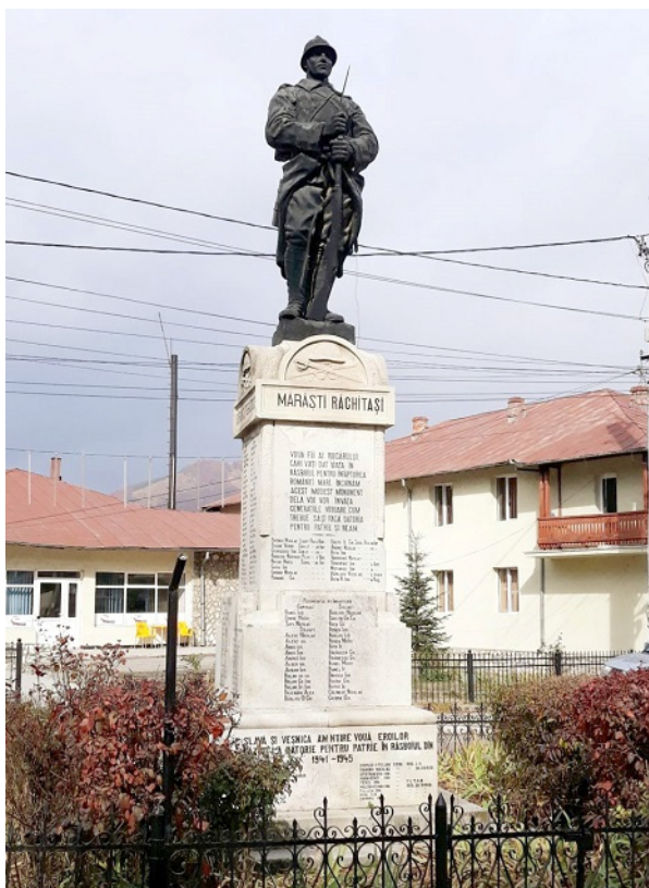
Fig. 8. Dumitru Mățăoanu, Giovanni e Victor Mezzarobba. Monumento dedicato agli Eroi di Rucăr (1924).

Un monumento analogo, raffigurante un milite armato sovrastante un massivo blocco di pietra, venne eretto nello stesso arco di tempo dai Mezzarobba per la natia cittadina di Rucăr (1924). L'opera in bronzo dedicata al combattente è attribuita al noto scultore Dumitru Mățăoanu (Câmpulung Muscel, 1888 – Bucarest, 1929) 37 .