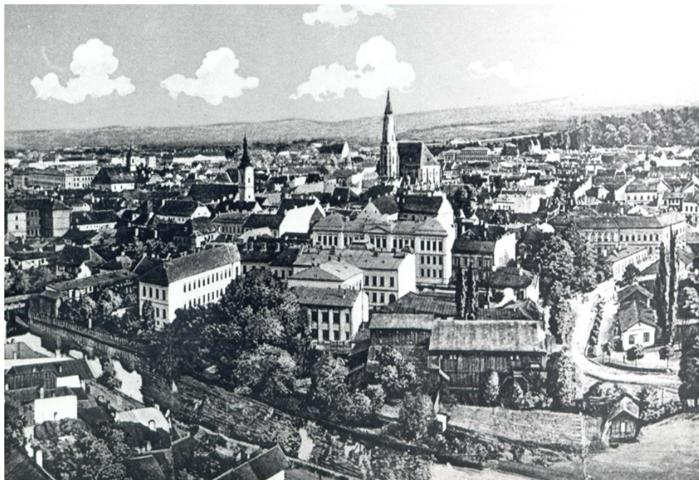
Fig. 1. Centrul Clujului dinspre Cetățuie. s. a.

În rândul acestor instituții s-a încadrat și Muzeul Industrial Franz Iosef I din Cluj, împreună cu Școala de Stat de Arte și Meserii pentru Construcții, Industria Lemnului și a Metalelor. O parte semnificativă a carierei lui Lajos Pákei a fost ocupată de înființarea muzeului industrial și a unei școli industriale. 5