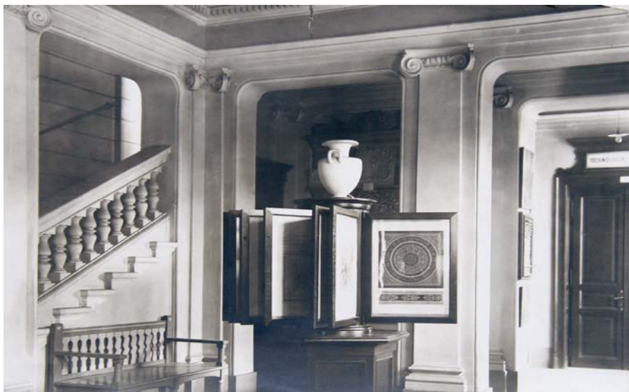
Fig. 8. Hala mecanică a muzeului și a școlii industriale, clădire proiectată de Lajos Pákei. s. a. ABUDC. Material Pákei, V-B-02.

două nivele superioare nu pot fi determinate cu certitudine în absența planurilor de la etaj. Zona de colecționare modificată a muzeului, colecția de Arte Decorative care completează obiectele industriale originale, a creat o nevoie semnificativă de spațiu expozițional, prin urmare, la nivelurile superioare putem presupune în principal săli de expoziții și, într-o măsură mai mică, camere și depozite.