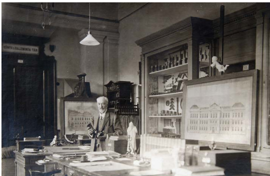
Fig. 4. Detaliu al colecției de artă decorativă modernă a Muzeului Tehnologic Industrial "Franz Josef I al Austriei" din Cluj-Napoca.

industriașii, antreprenorii și fabricanții din Cluj interesați de dezvoltarea urbană și industrială s-au reunit la nivel local. Fabricarea calitativă a produselor, proces ce solicita o tehnologie din ce în ce mai complicată, gestionarea complexă a echipamentelor din fabrici, instruirea specialiștilor, ca obligativitate a conjuncturii din domeniul construcțiilor, au făcut inevitabil transferul de competențe și expertiză în această direcție. Primele inițiative în sensul educației industriale moderne organizate la Cluj datează din 1878–1879. Ideea educației industriale conformă cadrului legal și de formare asigurate de Legea a II.-a a Educației a fost discutată prima oară în Camera de Comerț și Industrie din Cluj, caracterizată de la începuturi de satisfacerea nevoilor locale. Pregătirea specialiștilor din oraș și din împrejurimi, satisfacerea nevoilor industriei prelucrătoare locale și recrutarea elevilor din localitățile apropiate au rămas caracteristice pe tot parcursul funcționării școlii. Această formare continuă a specialiștilor locali a fost consolidată atât de Camera Industriei, cât și de rolul inițiator al orașului Cluj în înființarea școlii și a muzeului. 22 După înființarea școlii, pe lângă sprijinul din bugetul statului de aproximativ trei sferturi din suma necesară, aceste două instituții au fost