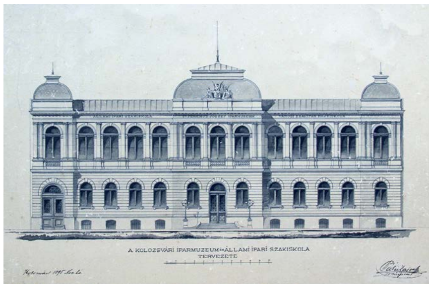
Fig. 2. Fațada principală a clădirii comune a Muzeului Industrii Tehnologice Transilvane din Cluj-Napoca (Muzeu Tehnologic Industrial "Franz Josef I al Austriei") și a Școlii Profesionale de Construcții, Industria Lemnului și Metalelor, proiectată de Lajos Pákei și construită între 1896 și 1898. Proiect din noiembrie 1895. Arhiva Bisericii Unitariene din Cluj (ABUdC). Material Pákei, I-B-043. Reproducere: Lehel Molnár.

Transilvania. Și ne gândim aici la renovarea colegiului din Aiud la începutul secolului al XVIII-lea și extinderea colecțiilor sale, pregătirea inventarelor și a mobilierului pentru depozitarea cărților, în legătură cu care mai multe versiuni ale termenului de muzeu apar pentru prima dată în contextul maghiar. 7